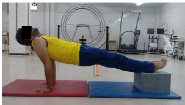
تصویر ۳. تمرین ثبات مرکزی Hand-heel

تمرین بعدی که انجام شد، تمرین Hand-heel بود. در این تمرین ورزشکار با اکستنشن کامل آرنج ها و اندام تحتانی، در وضعیت طاقباز قرار گرفت و یک جعبه به ارتفاع ۲۰ سانتی متر زیر پای فرد قرار داده می‌شد. در این حالت سر، لگن و پاها در یک راستا بود و ورزشکار این وضعیت را برای مدت ۳۰ ثانیه حفظ می‌کرد (تصویر ۳) [۱۹].