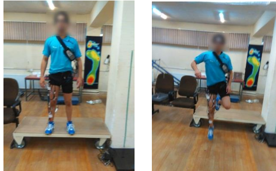
تصویر ۲: محل ایستادن آزمودنی‌ها و نحوه اجرای آزمون

جلویی سکو از محلی که برای فرود آزمودنی‌ها علامت‌گذاری شده بود، ۱۵ سانتی‌متر فاصله داشت. [۳۳] آزمودنی‌ها صرفاً عمل فرود و نه عمل پرش به بالا و یا جلو را انجام دادند؛ در حالی که در سرتاسر تمرین دست‌شان روی لگن بود. [۳۳] فرود قابل قبول شامل تماس پنجه پا در ابتدا، حفظ تعادل و توانایی فرود آمدن بدون جهش بود. [۳۳] آزمودنی‌ها در حالی که سعی می‌کردند راستای تنه را حین فرود حفظ کنند، فرود طبیعی خود را انجام می‌دادند. [۳۳] (تصویر ۲).