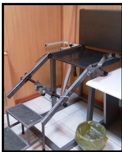
تصویر ۱: صندلی مخصوص طراحی شده برای اندازه‌گیری حداکثر گشتاور اکستانسوری زانو با سه درجه آزادی برای تنظیم درست داینامومتر

نیروی عضله قبل از اعمال تیپ اندازه گرفته شد.