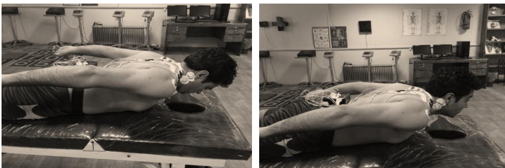
تصویر ۳: حرکت Y بدون ریترکشن سر (سمت راست) و با ریترکشن سر (سمت چپ)

حرکت Y؛ شروع در موقعیت دمر با ابداکشن ۱۲۰ درجه شانه‌ها؛ شروع فعالیت شامل به اکستنشن بردن تنه (بالا و همکاران، ۲۰۱۲ و لانچ و همکاران ۲۰۱۰) بود.