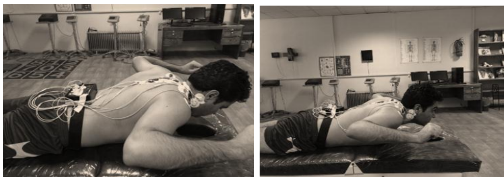
تصویر ۲: حرکت کبرا بدون ریترکشن سر (سمت راست) و با ریترکشن سر (سمت چپ)

حرکت Y؛ شروع در موقعیت دمر با ابداکشن ۱۲۰ درجه شانه‌ها؛ شروع فعالیت شامل به اکستنشن بردن تنه (بالا و همکاران، ۲۰۱۲ و لانچ و همکاران ۲۰۱۰) بود.