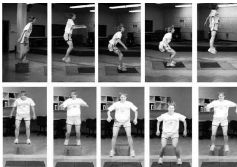
شکل ۲. نحوه انجام تست پرش-فرود [26]

شدند. سپس مراحل تست به این شکل انجام می‌گرفت: دویدن به سمت جلو، دویدن به سمت عقب، دویدن جانبی، دویدن جانبی حرکت یک بار به پشت و یکبار به جلو، دویدن به شکل ۸، دویدن دور تمام نوار چسب‌های مثلثی، دویدن دور مثلث ابتدایی به صورت پا به خارج، دویدن دور مثلث ابتدایی به صورت پا به داخل، دویدن به سمت جلو و دویدن به سمت عقب. ورزشکار برای شروع در مثلث جنوبی قرار گرفت و در شروع و پایان تست دویدن به جلو و دویدن به عقب (به ترتیب جنوب-شمال-جنوب)