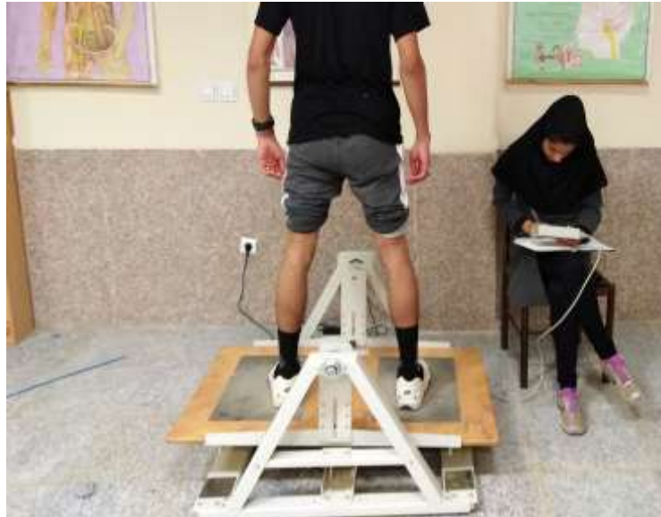
شکل ۱. دستگاه سنجش ثبات نیمه‌پویا

می‌داد و در این حالت تعادل خود را روی دستگاه حفظ می‌نمود. دستگاه مدت زمانی که آزمودنی می‌توانست صفحه ناپایدار را در 3 \pm حفظ کند، به عنوان تعادل فرد ثبت می‌کرد. اگر آزمودنی قادر بود عدد بالاتری را کسب کند، تعادل نیمه‌پویای بهتری داشت. برای هر آزمودنی، آزمون سه مرتبه اجرا شد و هر دفعه ۳۰ ثانیه طول کشید. قبل و حین آزمون هیچ دستورالعمل یا بازخورد کلامی به آزمودنی داده نشد. [۱۲۲]