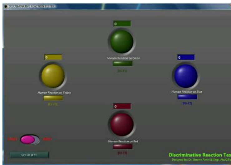
تصویر ۲: صفحه ی نمایش و محرک های آزمون

ابتدا هدف از انجام این پژوهش و مراحل انجام آن برای افراد شرکت کننده در این پژوهش توضیح داده شد. پس از تفهیم کامل مطالب و رضایت بیمار برای شرکت در پژوهش فرم رضایت نامه در اختیار او قرار می گرفت و از وی خواسته می شد که پس از مطالعه و تفهیم کامل آن را امضا کند. اطلاعات آنتوپومتریک هر یک از آزمون شونده ها بعد از انتخاب مد دیداری وارد می شد و سپس زمان واکنش بینایی ساده با استفاده از نرم افزار (SART) برای دو محرک نوری قرمز و سبز اندازه گرفته می شد. در این آزمون ابتدا فرد آزمون شونده در مدت کوتاهی به روش خود تمرینی با نرم افزار آشنا می شد و سپس آزمون آغاز می گردید و آزمون شونده با فشردن شاسی مربوطه با دست نسبت به محرک پاسخ می داد. زمان عکس العمل با دقت ۱ میلی ثانیه و ۳۰ بار برای هر محرک توسط سیستم اندازه گیری و ثبت می گردید. در گزارش خروجی آزمون زمان واکنش، میانگین زمان ۳۰ بار پاسخ دهی آزمون شونده نمایش داده می شد [۱۵].