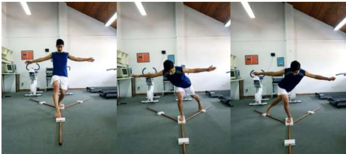
تصویر ۱. اندازه‌گیری تعادل پویا در سه جهت آزمون تعادلی Y

تمرینات موضعی عضلات اکستنسور و فلکسور زانو بودند؛ با این وجود، درحالی‌که در گروه کنترل تنها بر تمرینات عضلات زانو تمرکز شده بود، در دو گروه دیگر علاوه بر این تمرینات، مجموعه‌ای از حرکات درگیرکننده عضلات مفاصل