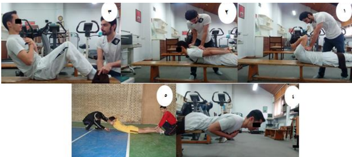
تصویر ۱. آزمون‌های قدرت، استقامت و انعطاف‌پذیری عضلات تنه (۱). قدرت فلکشن تنه، ۲. قدرت اکستنشن تنه، ۳. آزمون فلکشن تنه، ۴. آزمون سورنسن، ۵. ارزیابی انعطاف‌پذیری عضلات توراکو-ابدومینال (آزمون خیز تنه))

دینامومتر در ارزیابی قدرت ۹۵ تا ۹۸ درصد گزارش شد. [۲۴] (تصاویر شماره ۱ و ۲ از عکس شماره ۱). جهت سنجش استقامت عملکردی عضلات قدامی قسمت مرکزی بدن، ابتدا از ورزشکار خواسته شد که در وضعیت تکیه، درحالی‌که پشت او بر روی تخته ۶۰ درجه قرار داشت، هر دو مفصل ران را از زاویه ۹۰ درجه خم کند و دست‌ها را به حالت ضربدری روی سینه قرار دهد. با استفاده از استرپ بر روی مچ پا یا به‌وسیله ثابت کردن مچ پا به‌وسیله دست یک فرد کمکی، پای آزمودنی ثابت شد. برای شروع آزمون درحالی‌که ورزشکار در وضعیت تکیه به تخته ۶۰ درجه قرار داشت، تخته را ۱۰ سانتی‌متر از قسمت پشت ورزشکار دور کرده و از ورزشکار خواسته شد تا حد امکان این وضعیت را حفظ کند. مدت‌زمانی که ورزشکار قادر بود تا این وضعیت را حفظ کند، توسط کرنومتر ثبت شد. زمانی که پشت آزمودنی با تخته تماس حاصل می‌کرد، آزمون متوقف می‌شد. [۲۴] ضریب همبستگی درون‌گروهی آزمون سنجش استقامت فلکسور تنه برابر با ۰/۹۷ می‌باشد. [۲۵] (تصویر شماره ۳ از عکس شماره ۱). استقامت عضلات اکستنسور تنه به‌وسیله آزمون اصلاح‌شده سورنسن-بایرینگ سنجیده شد. ورزشکار به‌حالت دمر به‌طوری که لگن در لبه تخت معاینه قرار گرفته، دراز کشید. استرپ‌هایی برای تثبیت ورزشکار با تخت در نواحی پا و لگن به کار گرفته شد. ورزشکار بالاتنه خود را با کمک قرار دادن دست‌هایش بر روی نیمکت در مقابل تخت حمایت می‌کرد تا بتواند توانایی قرار دادن دست‌ها به‌صورت ضربدری و کسب یک موقعیت افقی را یاد بگیرد. ضمناً پای ورزشکار توسط یک فرد کمکی به منظور کمک به ثبات اندام تحتانی او، در تماس با تخت قرار می‌گرفت. ورزشکار باید سعی می‌کرد تا حد ممکن وضعیت افقی بدن