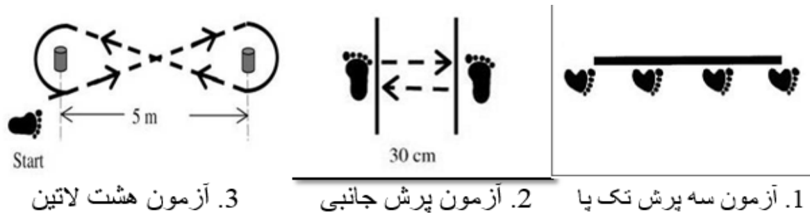
شکل ۲. آزمون‌های عملکردی پرش جانبی، آزمون هشت لاتین و سه لی تک پا