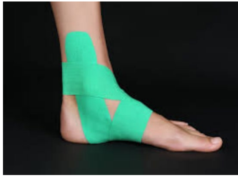
شکل ۳. نحوه انجام تیبینگ تمرینات قدرتی-تعادلی

پروتکل تمرینی مورد استفاده در جدول شماره ۱ گزارش شده است.