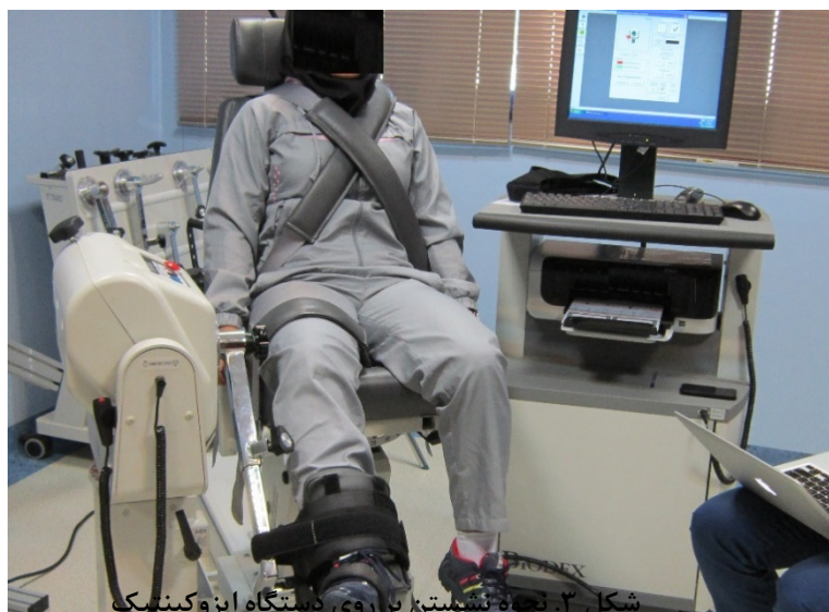
شکل ۳. نحوه نشستن بر روی دستگاه ایزوکینتیک

*مفصل هیپ در زاویه تقریباً ۱۰۰ درجه تنظیم شد و تنه و ران با بلت‌های ویژه به صندلی بسته و محکم شد. ساق پا با استفاده از تسمه‌ای ویژه در پوزیشن حداکثر چرخش خارجی قابل تحمل آزمودنی قرار گرفت.