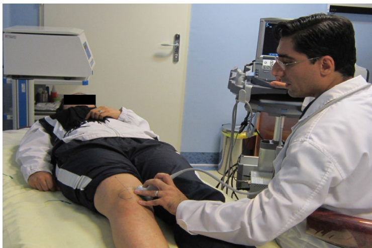
شکل ۱. پوزیشن آزمودنی و روش تصویربرداری سونوگرافی

پژوهش حاضر از نوع پژوهش‌های نیمه‌تجربی و به لحاظ هدف از نوع پژوهش‌های کاربردی است. جامعه آماری پژوهش را کلیه زنان مبتلا به سندروم فشار خارجی پاتلوفمورال تشکیل داده‌اند. نمونه‌های تحقیق به روش در دسترس از بین مراجعه‌کنندگان شهر تهران به کلینیک‌های ارتوپدی و فیزیوتراپی که شرایط ورود به مطالعه را داشته و حاضر به شرکت در مطالعه بودند، انتخاب شدند. ۳۰ نفر از این بیماران به‌طور تصادفی به یکی از ۲ گروه تجربی (۱۵ نفر) و کنترل (۱۵ نفر) اختصاص داده شدند. از بین آزمودنی‌ها، ۲۴ نفر راست‌پا و ۶ نفر چپ‌پا بودند. معیارهای ورود آزمودنی‌ها به تحقیق ۱۲ عبارت بودند از احساس درد در اطراف مفصل پاتلوفمورال به‌ویژه کناره خارجی آن در حداقل دو مورد از فعالیت‌های نشستن طولانی‌مدت، بالا رفتن از پله‌ها، اسکات، دویدن، دو زانو نشستن و لی‌لی کردن، مثبت بودن جواب تست کلارک، مثبت بودن جواب تست عملکردی زانو، مثبت بودن جواب تست فشار پاتلا، مثبت بودن جواب تست وحشت پاتلا، وجود علائم سندروم فشار خارجی پاتلوفمورال در طول مدتی بیش از ۶ ماه و محدوده سنی ۱۸ تا ۳۰ سال. معیارهای خروج از پژوهش ۱۱ حاضر عبارت بودند از وجود هر گونه آسیب‌های منیسکی یا لیگامنتی زانو، آرتروز زانو، سابقه دررفتگی شدید پاتلا، سابقه قفل‌شدگی زانو، سابقه فیزیوتراپی یا جراحی زانو، وجود اختلالات نورولوژیکی مانند نقص در سیستم دهلیزی، باردار بودن آزمودنی‌ها،