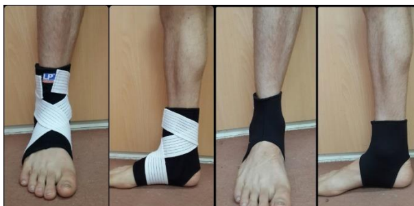
تصویر ۳: بریس نئوپرینی تصویر ۴: بریس بنددار